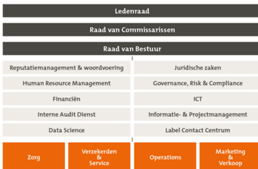
Figuur 2 Organisatiestructuur CZ groep

Figuur 2 geeft een totaaloverzicht van de organisatiestructuur.