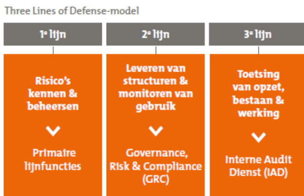
Figuur 3 'Three Lines of Defense-model binnen CZ groep

Binnen het 'Three Lines of Defense'-model wordt van de eerste lijn (de primaire lijnfuncties) verwacht dat zij hun risico's kennen en (aantoonbaar) beheersen. De tweede lijn (vooral GRC) levert daarvoor de structuren en monitort (direct of indirect) het gebruik daarvan. De derde lijn (de Interne Audit Dienst (IAD)) stelt daarbij vast of dit model werkt en leidt tot een effectief aangetoonde beheersing. Dit doet de IAD door o.a. de werking van de beheersmaatregelen te toetsen.